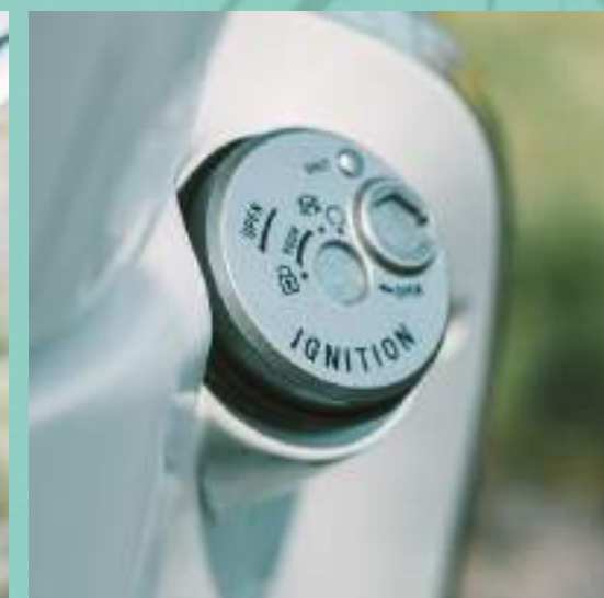
BLOCCO DELLA SERRATURA