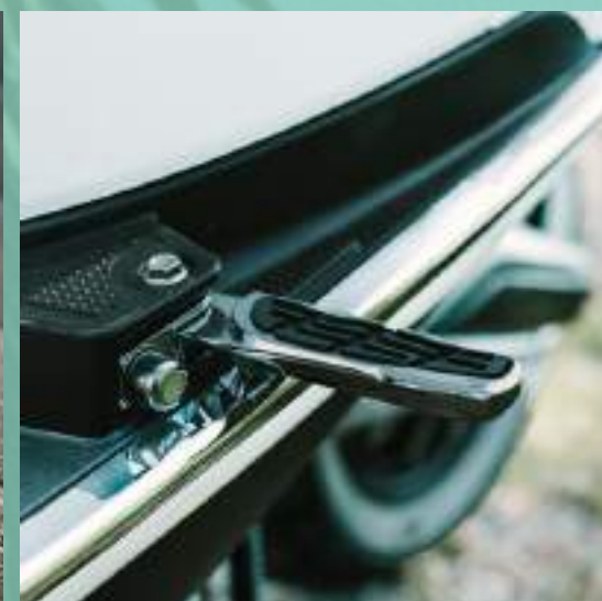
PEDANE PASSEGGERO RETRATTILI