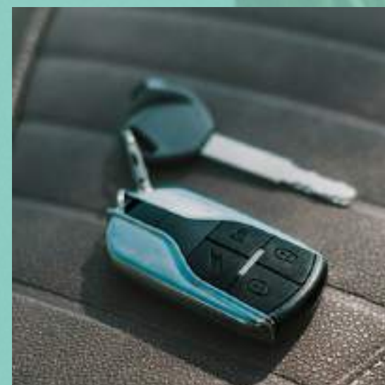
ANTIFURTO DI SERIE CON IMMOBILIZER

Leggero e maneggevole, garantisce un controllo intuitivo grazie al pannello di bordo, il suo design raffinato e le finiture di alta qualità lo rendono ideale per lavoro e tempo libero, incarnando lo stile della nuova mobilità sostenibile.